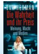
Eva Herman Die Wahrheit und ihr Preis